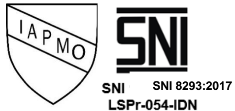
Figure 1. Certification Marking and SNI